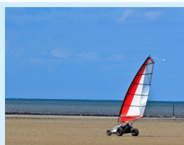
le char à voile